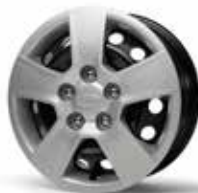
LOUNGE - MIND - WORLD EDITION Jantes en acier avec pneus 195/65 R15 et enjoliveurs