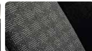
Revêtement des sièges en tissu type 'Houndtooth check'