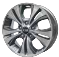
SENSE Jantes en aluminium avec pneus 205/55 R16