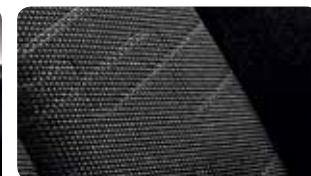
Revêtement des sièges en tissu type 'Embossed' avec liseret métallisé