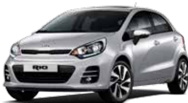
Bright Silver (3D) Metallic