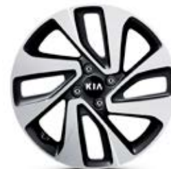
SENSE Jantes en aluminium avec pneus 205/45 R17