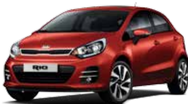
Signal Red (BEG) Pearl