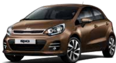
Wendy Brown (DBS) Pearl Metallic