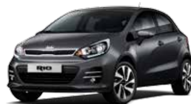
Graphite (ABT) Pearl Metallic