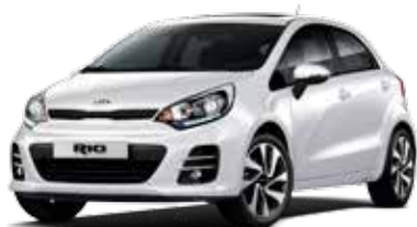
Clear White (UD) Solid