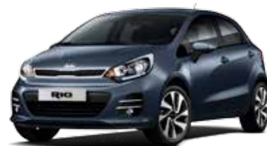
Formal Deep Blue (BLA) Pearl Metallic