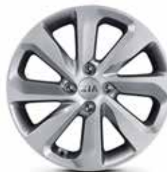
WORLD EDITION Jantes en aluminium avec pneus 195/55 R16