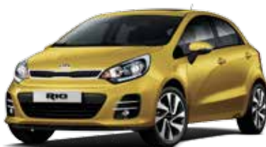
Digital Yellow (DYS) Solid*