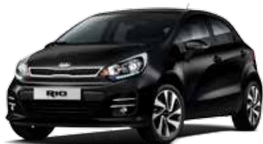
Black (ABP) Pearl