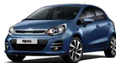
Urban Blue (EU2) Pearl Metallic