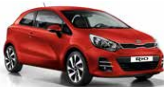
Signal Red (BEG) Pearl