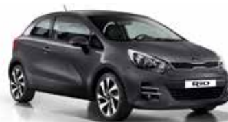
Graphite (ABT) Pearl Metallic