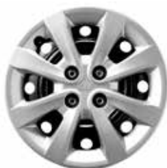
LOUNGE - EASY - FUSION Jantes en acier 15" avec pneus 185/65 R15 et enjoliveurs