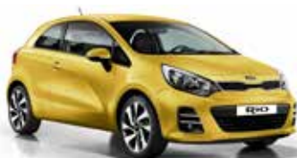
Digital Yellow (DYS) Solid