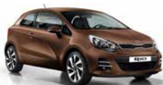
Wendy Brown (DBS) Pearl Metallic