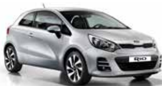
Bright Silver (3D) Metallic