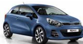
Urban Blue (EU2) Pearl Metallic