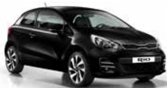
Black (ABP) Pearl