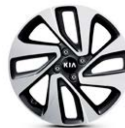
SENSE Jantes en aluminium avec pneus 205/45 R17