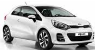
Clear White (UD) Solid