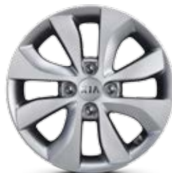
MIND Jantes en aluminium avec pneus 185/65 R15