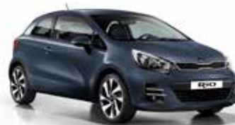
Formal Deep Blue (BLA) Pearl Metallic